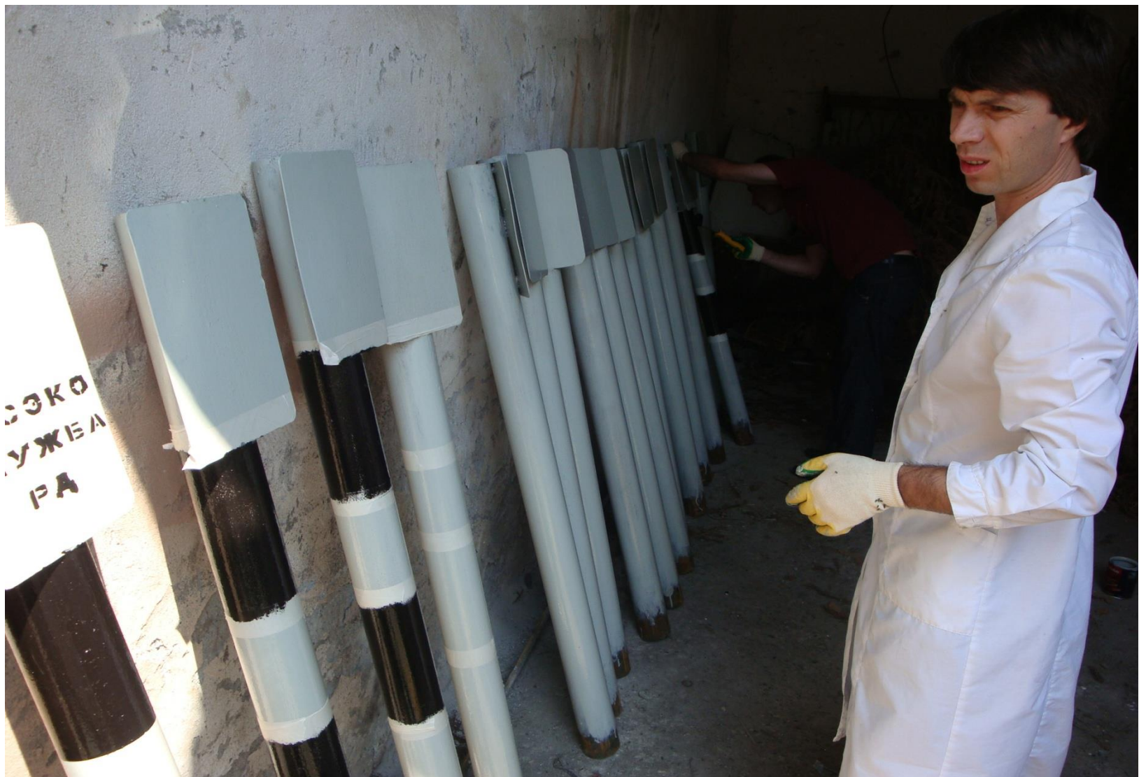
ЛАБОРАТОРИЯ ДИНАМИКИ БЕРЕГОВЫХ ПРОЦЕССОВ