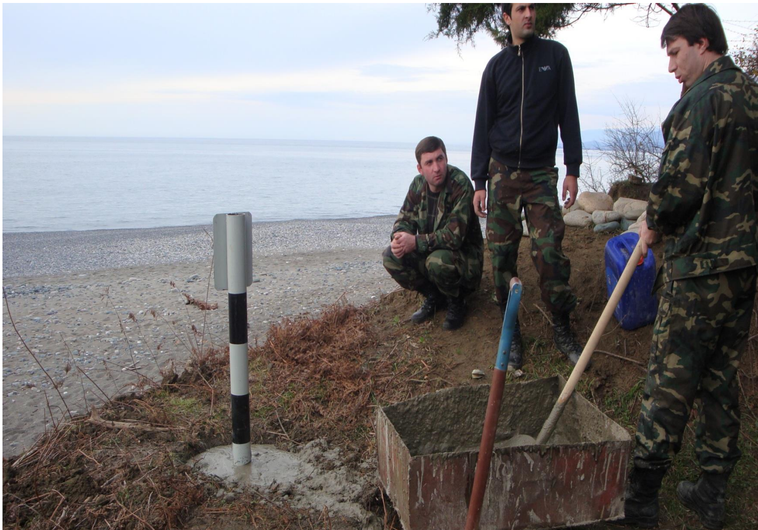
ЛАБОРАТОРИЯ ДИНАМИКИ БЕРЕГОВЫХ ПРОЦЕССОВ