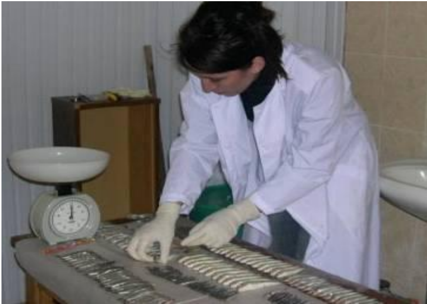
ЛАБОРАТОРИЯ ПРОГНОЗА И ЗАПАСА РЫБНЫХ РЕСУРСОВ